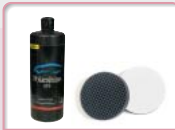
VF5 (ブラックドットバフ)