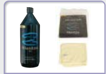
UF3 (クリーニングクロス)