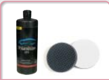
VF5 (ブラックドットバフ)

最終仕上げはバフを平行に保ち、ゆっくりと運行させることによりオーロラマークを除去します。 ブラックドットパッド使用時は、全体に均一なポリッシングを行うと効果的です。