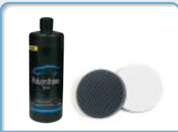
T10 (ブラックドットバフ)