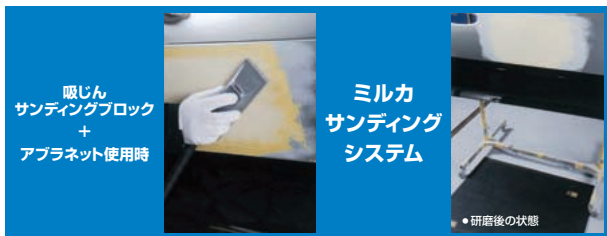
吸じん サンディングブロック + アブラネット使用時